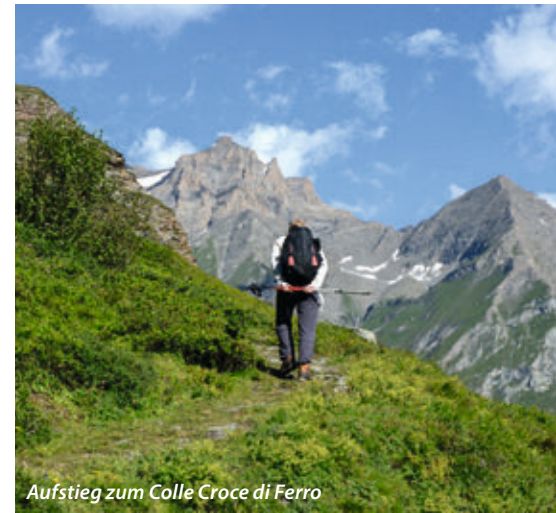
Aufstieg zum Colle Croce di Ferro

Italienern in den Bergen zu begegnen, ist immer eine sehr freundliche Angelegenheit. Ein „Buon giorno“, ein „Salve“ ist selbstverständlich. „Prego“, um den anderen vorbeizulassen, „Grazie“ als Dank dafür gehören sich einfach. Und wenn es die Verständigung zulässt, bekommen wir sehr viel Hochachtung für unsere wochenlange Wanderung. Immer wieder klingt auch an, dass Italiener zwar hervorragende Bergsteiger sind und waren, aber eben nicht so den Draht zum Wandern gefunden haben. Daher treffen wir Tagesausflügler in Parkplatznähe, aber niemanden, der auf längeren Strecken unterwegs ist.