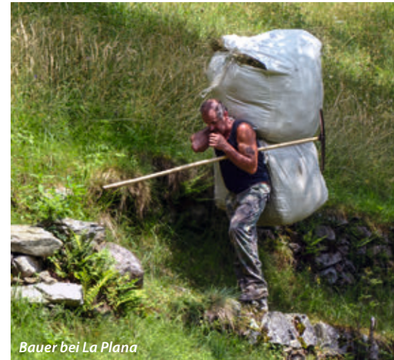
Bauer bei La Plana

Diese und die nächste Nacht verbringen wir in Klöstern. Nach der Nacht im Santuario San Giovanni hindert uns frühmorgens ein heftiges Unwetter mit Starkregen und Gewitter am Aufbruch. Zum Glück ist die Etappe kurz, da wir uns den Weg zwischen entwurzelten Bäumen erst suchen müssen – das Unwetter hat ganze Arbeit geleistet.