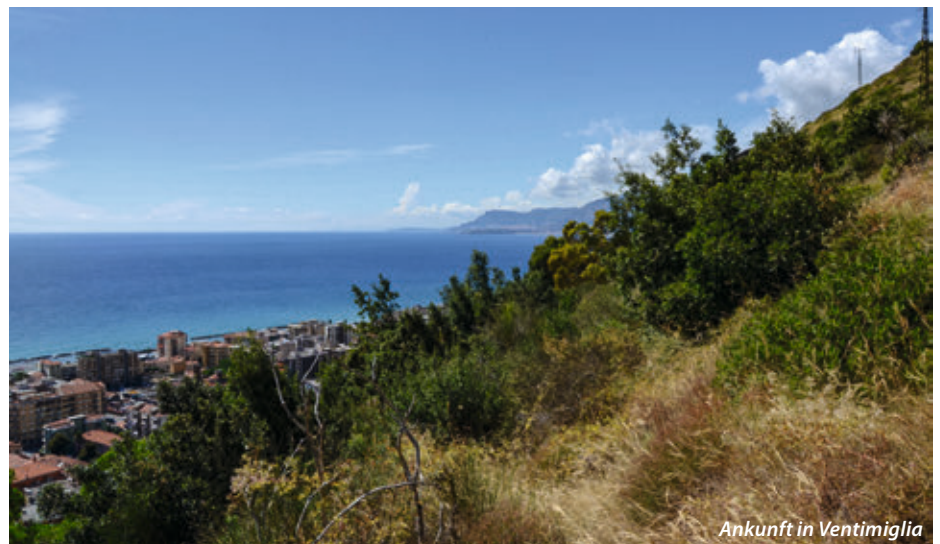
Ankunft in Ventimiglia