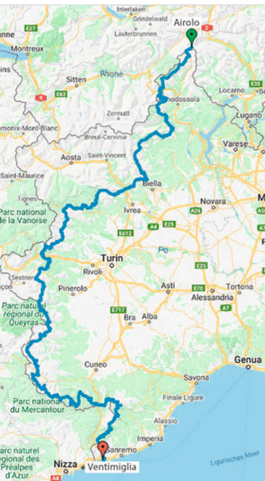
Die Route. Karte: OpenStreetMap

Ich entscheide mich für das Herantasten an die Variante, um herauszufinden,