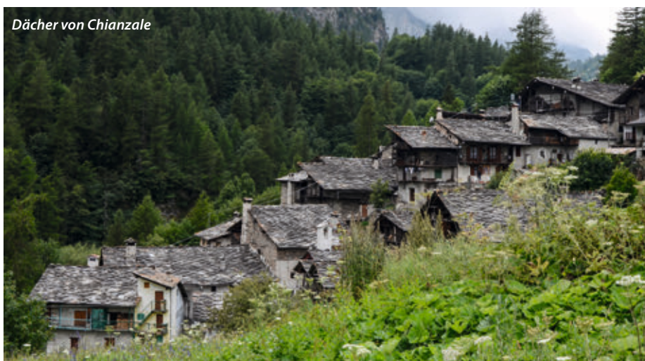
Dächer von Chianzale

Das Hotel Arrucador liegt in einem kleinen Skigebiet und wird im Winter vom (Geld-)Adel der Côte d'Azur besucht.