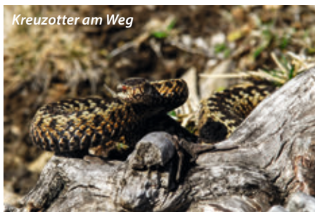
Kreuzotter am Weg

Der Kreuzotter neben dem Weg gefällt weder das Fotografieren noch das Filmen, was sie durch vernehmbares